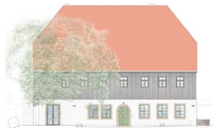
Ansicht unseres Kaditzer Pfarrhauses vom Pfarrhof aus nach der Sanierung

In den vergangenen Jahren zeichnete sich immer stärker ab, dass das 1802 bei einem Brand zerstörte und wieder aufgebaute Pfarrhaus einer Komplettsanierung unterzogen werden muss.